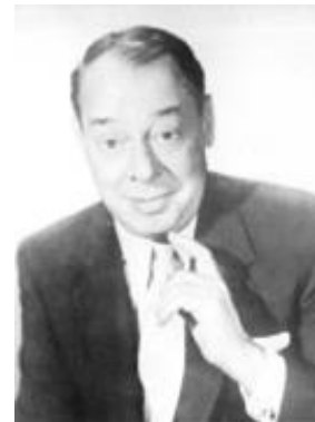
Joe. E. Lewis Amerikanischer Comedy Star