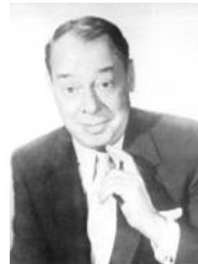
Joe. E. Lewis American Comedy Star